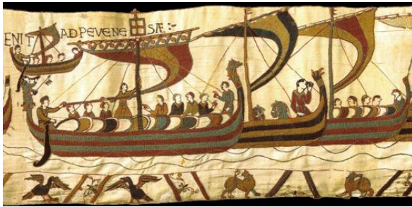
Tapisserie de Bayeux

Les drakkars réclament une forte main-d'œuvre spécialisée. Les artisans utilisent des haches pour débiter les pièces de bois, des racloirs pour les façonner et des tarières pour les percer.