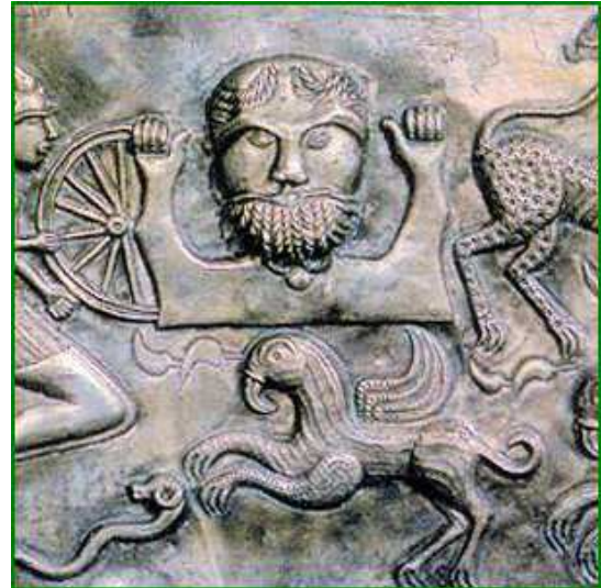
Taranis est le dieu du Ciel et du Tonnerre

A ton avis que signifie « Polythéiste » ? Cela signifie