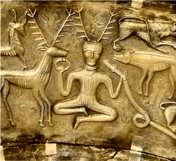
Cernunnos est le dieu de la Nature et du Renouveau (chaudron de Gundestrup au Danemark, vers 100 avant J.C)