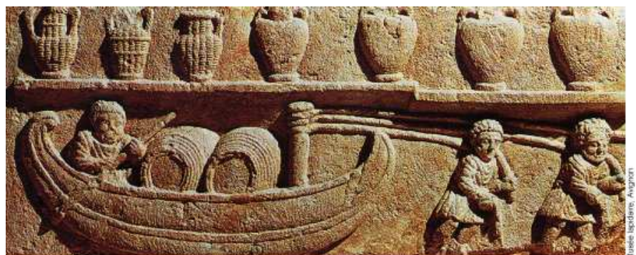
Bas-relief gallo-romain représentant une scène de halage