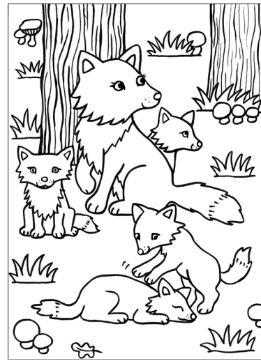
une renarde avec ses renardeaux