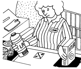
la caissière du supermarché