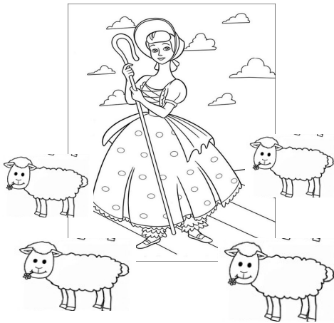
la bergère et ses moutons